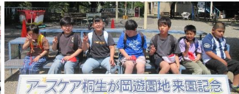
アースケア桐生が岡遊園地 来園記念 令和8年5月13日