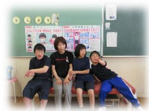
中学部の検診&順番待ち